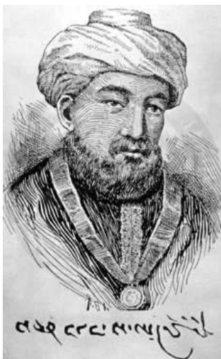
Maimónides: Abu 'Imran Musa ben Maimun ibn 'Abd Allah.

http://www.religionfacts.com/judaism/people/maimonides.htm